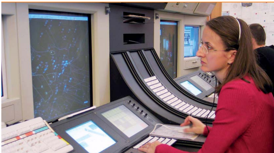
Fluglotsin bei Austro Control

Migration von FORMS 3.0 auf 10g mit PITSS.CON