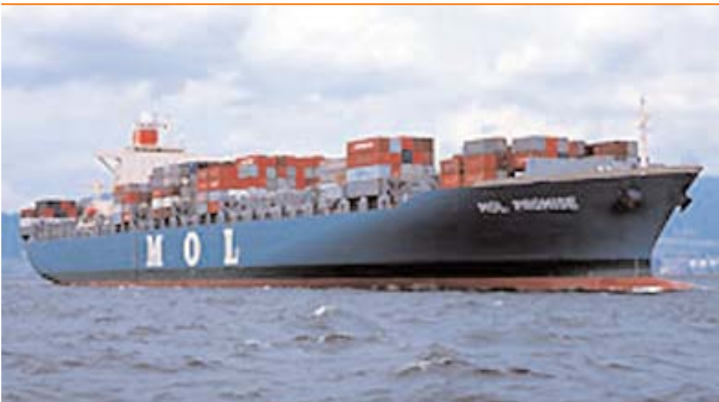
Container ship MOL

Projekt: Migration von Oracle Forms 6i cs nach 10g mit PITSS.CON